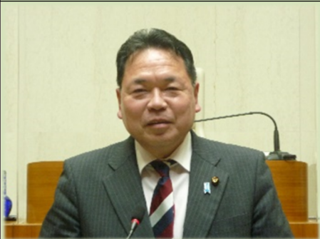
会派代表質問に立つ