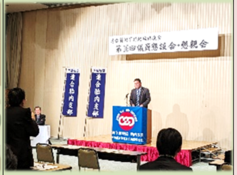
連合胎内議員懇談会