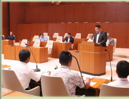
議会モニター会議