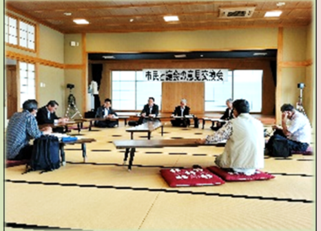
市民との意見交換会